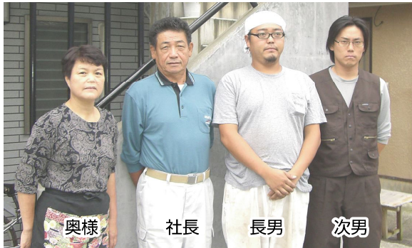
奥様 社長 長男 次男

住所 沼津市戸田二〇六一 TEL0558・94・2263 FAX0558・94・2263